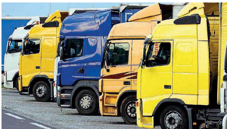
Autotrasporto in crisi | Taglio accise e credito di imposta hanno congelato la protesta

■ L'esito dell'incontro con il governo ha scongiurato i 5 giorni di blocco e ferma per il momento la protesta nel mondo dei mezzi pesanti. Gli impegni assunti dall'esecutivo nell'incontro di venerdì 22 maggio con le sigle dell'autotrasporto hanno portato Unatras a sospendere, per il momento, il fermo dei mezzi già programmato dal 25 al 29 maggio per protestare contro gli effetti devastanti che il caro carburante sta avendo sul settore. “Si tratta di misure che non risolvono tutti i problemi delle imprese di trasporto ma certamente rappresentano un primo segnale concreto verso le richieste formulate dalle nostre associazioni a sostegno della categoria” - hanno commentato i vertici regionali di Cna Fita, Confartigianato Trasporti, Confcooperative e Legacoop Produzione e Servizi. Un risultato che arriva insieme alle notizie di una possibile imminente riapertura dello stretto di Hormuz, che fa crescere la speranza di un miglioramento dei costi energetici. I provvedimenti sui quali il governo si è impegnato nel corso dell'incontro presieduto dalla presidente del consiglio Giorgia Meloni riguardano innanzitutto lo stanziamento di 200 milioni di euro, oltre ai 100 già previsti, sotto forma di credito d'imposta per compensare i maggiori costi sostenuti dalle imprese di trasporto per il carburante, pe-