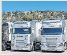
I Tir non si fermano

«Si tratta di misure che non risolvono tutti i problemi delle imprese di trasporto ma certamente rappresentano un primo segnale concreto verso le richieste formulate dalle nostre associazioni a sostegno della categoria», commentano i vertici regionali di Cna Fita, Confartigianato Trasporti, Confcooperative e Legacoop Produzione e Servizi. Un risultato che arriva insieme alle notizie di una possibile imminente riapertura dello stretto di Hormuz: si fa più concreta la spe-