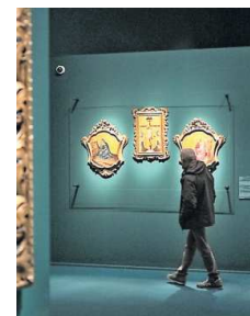
Uno dei tanti eventi culturali (una mostra) che si tengono a Perugia

NELLO STESSO PERIODO L'ITALIA CRESCE E IL CENTRO RIESCE A TENERE