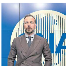
Il presidente Michele Carloni

«L'export dei prodotti made in Italy realizzati in Umbria - dice Carloni - è cresciuto anche nel 2025 (+0,5%) nonostante l'entrata in vigore dei dazi sui prodotti esteri decisi dall'amministrazione Trump e le incertezze derivanti dall'altaleone di dichiarazioni del presidente statunitense. Che però hanno avuto un effetto consistente sulla metallurgia e sulla chimica umbre, diminuite complessivamente del 6,3%. Ma sono soprattutto i conflitti in corso, a cominciare da quello in Medio Oriente che mette a rischio l'autonomia energetica e la libera circolazione delle navi commerciali, a gettare un'ombra sinistra sull'export 2026, con un calo previsto di almeno l'1%. Dalla ricerca emerge che tra il 2015 e il