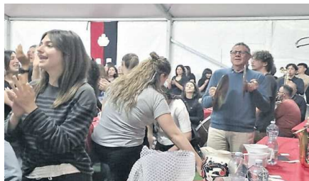
Un momento della cena organizzata dalle Santantoniare