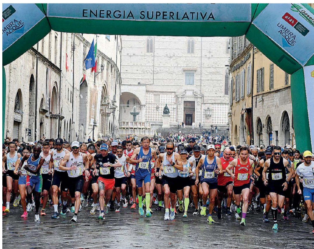
Grande partecipazione La partenza della Grifonissima, edizione numero 45 → nell'inserto Sport, alla pagina XX