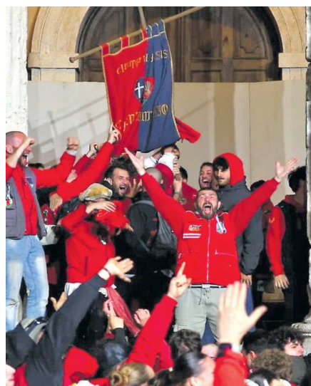
I partaioi rossi con il palio appena vinto

Calendimaggio in rosso Parte de Sotto fa festa