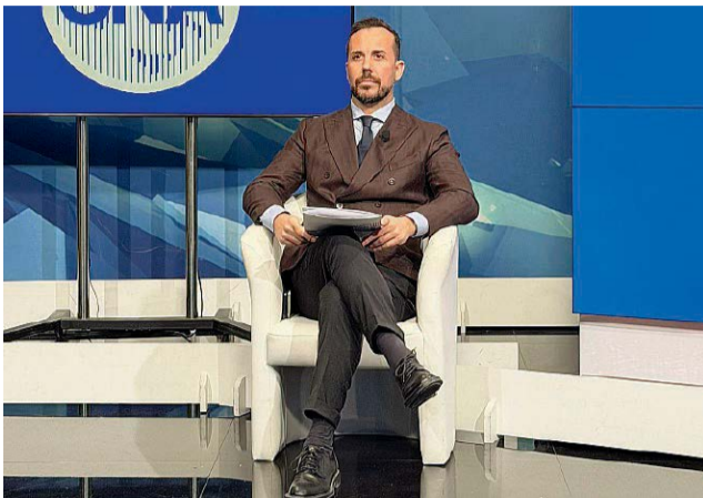
Presidente regionale Michele Carloni è al vertice umbro della Confederazione nazionale dell'artigianato e della piccola e media impresa

“Il report ha evidenziato che l'apertura commerciale dell'Umbria, calcolata come sommatoria tra esportazioni